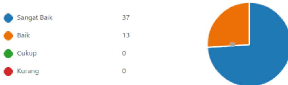
Gambar 3 Persentase Kepuasan Alumni Terhadap Item Pertanyaan No.2

Dari diagram diatas dari 50 responden, diperoleh sebanyak 81% alumni merasa fasilitas sarana dan prasarana di Prodi Manajemen Universitas Efarina sudah menjawab "Sangat Baik", dan sebanyak 15% alumni menjawab "Baik".