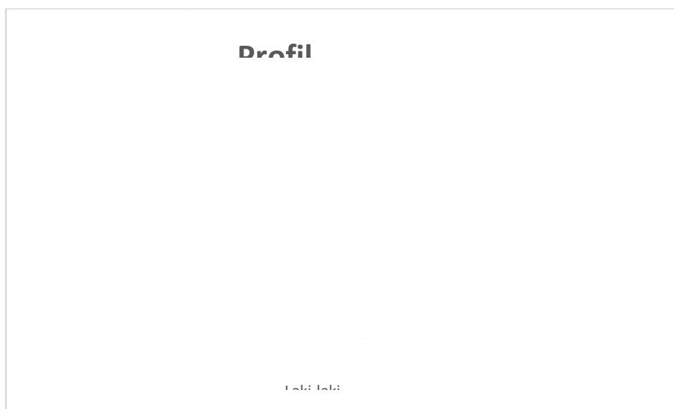
Gambar 1. Sebaran responden berdasarkan jenis kelamin