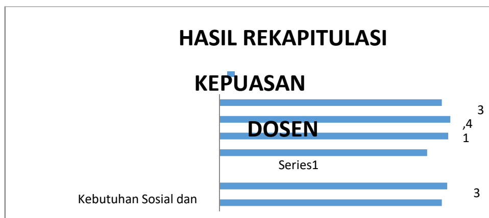
Gambar 4. Grafik Kepuasan Dosen